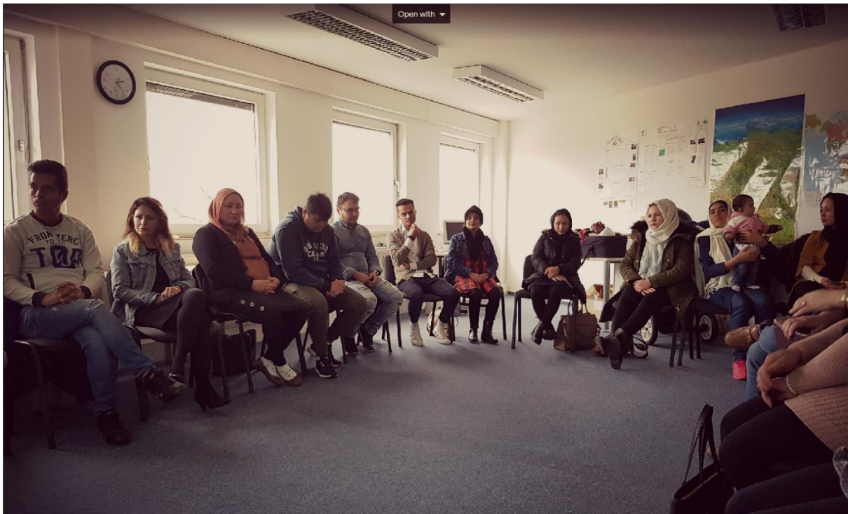
Familienworkshop am 17.11.2018