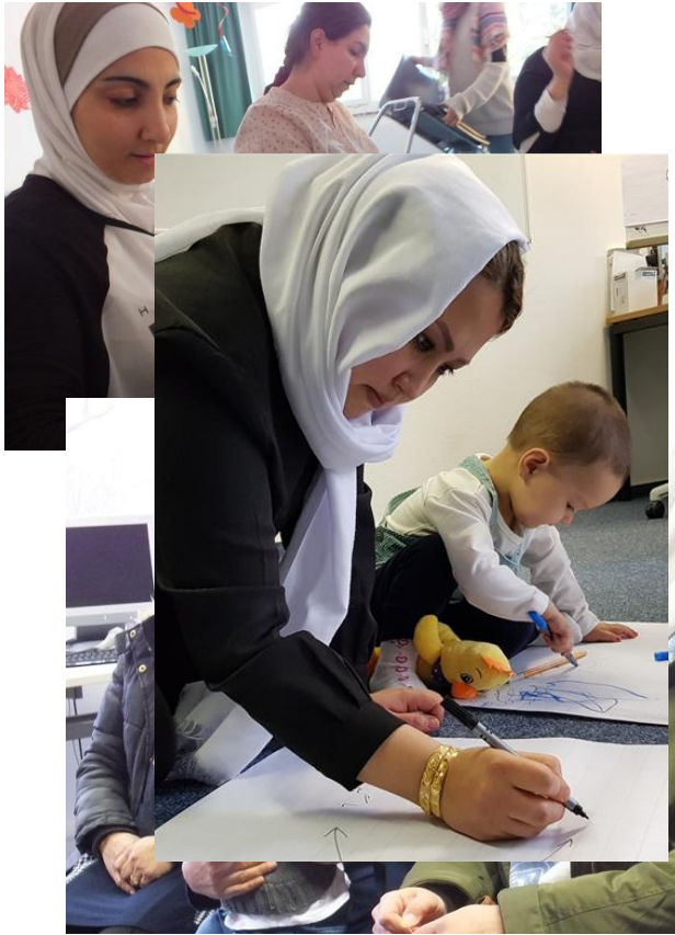
Familienfreizeit in Oberhof 22-25.07.2017 Familienworkshop am 11.05.2019